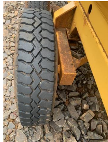
8.17. Foto 17