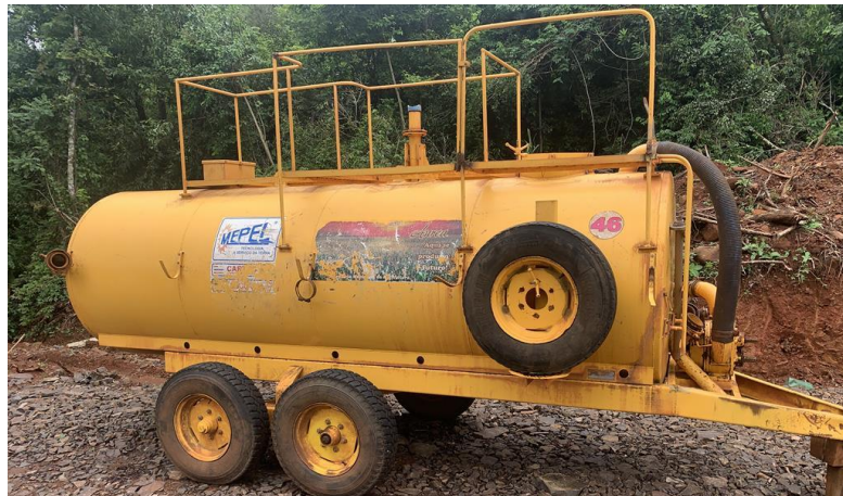
8.5. Foto 5