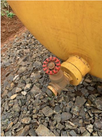
8.10. Foto 10