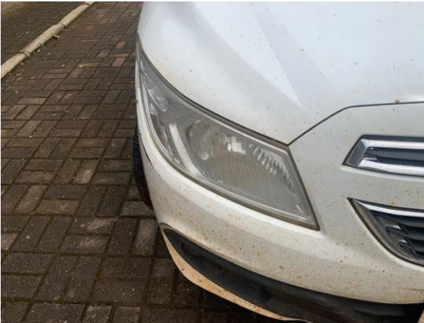
8.7. Foto 7