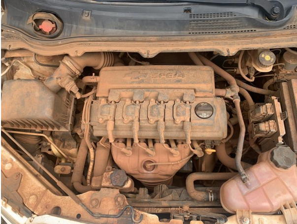
8.22. Foto 22