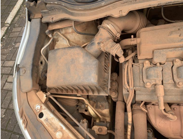
8.25. Foto 25