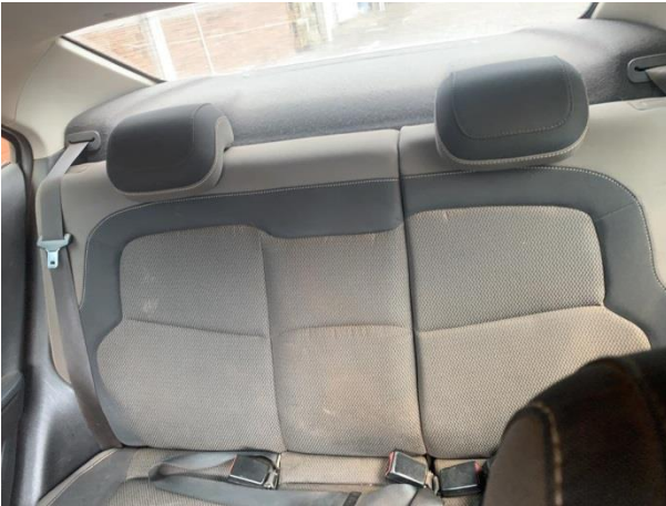
8.16. Foto 16