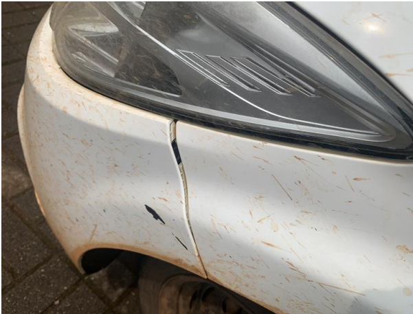
8.10. Foto 10