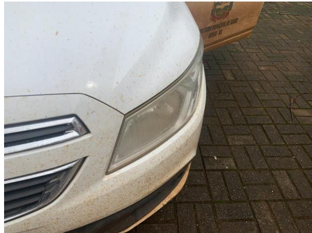
8.8. Foto 8