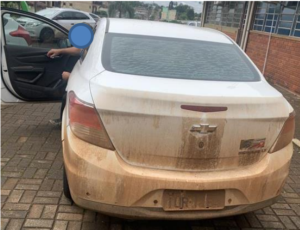
8.4. Foto 4