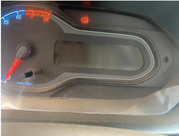
8.19. Foto 19