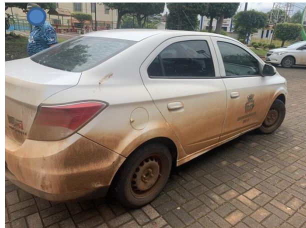
8.5. Foto 5