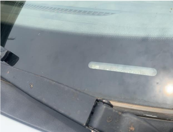
8.13. Foto 13